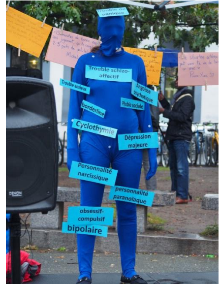
Blue women 1

Si nous voulons avoir une chance de gagner nos revendications stratégiques, évitons de choisir des actions irréalistes, qui nous décourageront au premier obstacle. Pour garder la motivation, les stratégies et moyens d'action choisis doivent correspondre à ce qui enthousiasme les personnes qui les prendront en charge et aux ressources dont elles disposent. Ainsi, on reste sur un terrain qu'on connaît, qu'on maîtrise et qui nous donne plus de force et de confiance. Soyons toutefois inventifs! Il faut oser, risquer, avoir de l'audace dans nos actions!